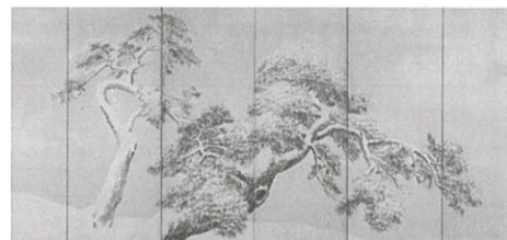
「雪中松図屏風」円山応挙筆