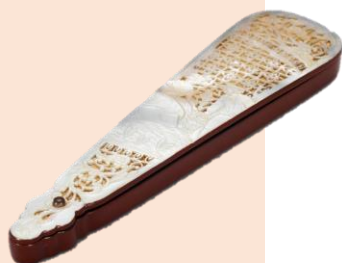
スペイン扇子親骨香合 三砂良哉作

ご来館にはなるべく公共交通機関をご利用ください。駐車場の数には限りがございます。