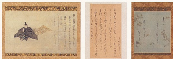
佐竹本三十六歌仙切 藤原高光 高野切第三種 堺色紙

流麗な筆致、工夫を凝らした料紙、古人の遺した美しい書の数々は、書の愛好者のみならず茶の湯の世界でも愛好されてきました。数寄者をも魅了した書の作品をご覧ください。