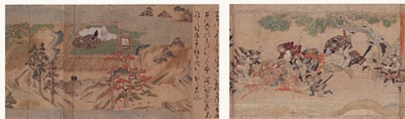
芦引絵(部分) 大江山絵詞(部分)

説話や物語の場面場面、絵画にも表す絵巻。見進めるにつれ、作品の世界に知らず知らずの内に入り込んでしまいます。細やかに描かれた人物・場景・季節などが次から次へと現れ、私たちの眼を楽しませます。この展示では、重要文化財に指定された経巻も併せて陳列し、巻物形式の作品の淵源を示すこととします。